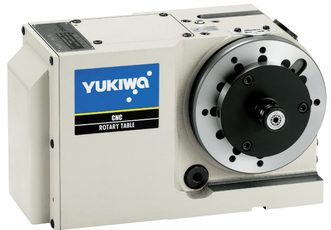
フランジ型NDCホルダのCNC円テーブルへの搭載例 Examples of flange-type NDC holder mounted on CNC rotary table.